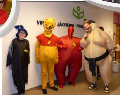
Hressir kennarar skólans bregða á leik með nemendum.