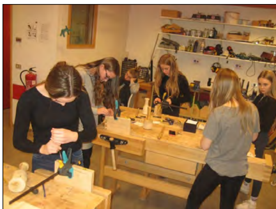
Stúlkur í 8. bekk leggja lokahönd á fallega útskornar gestabækur sem þær lögðu mikla vinnu í.