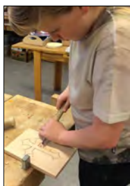
Gestabækurnar verða notaðar í komandi fermingum

Nemendur í eldri deild hafa verið að gera stórglæsileg verkefni í vetur þar sem þeir fá að þróa og útfæra hugmyndir sínar. Um annarskil lögðu nemendur í 7. bekk lokahönd á verkefni sín í smíði þar sem þeir gerðu hreyfileikföng af öllum stærðum og gerðum. Nemendur í 8. bekk kláruðu útskornar gestabækur sem margar hverjar verða notaðar í komandi fermingum. Þessi verkefni voru flest til sýnis í eldri deild á foreldarviðtalsdaginn sem haldinn var í byrjun febrúar.